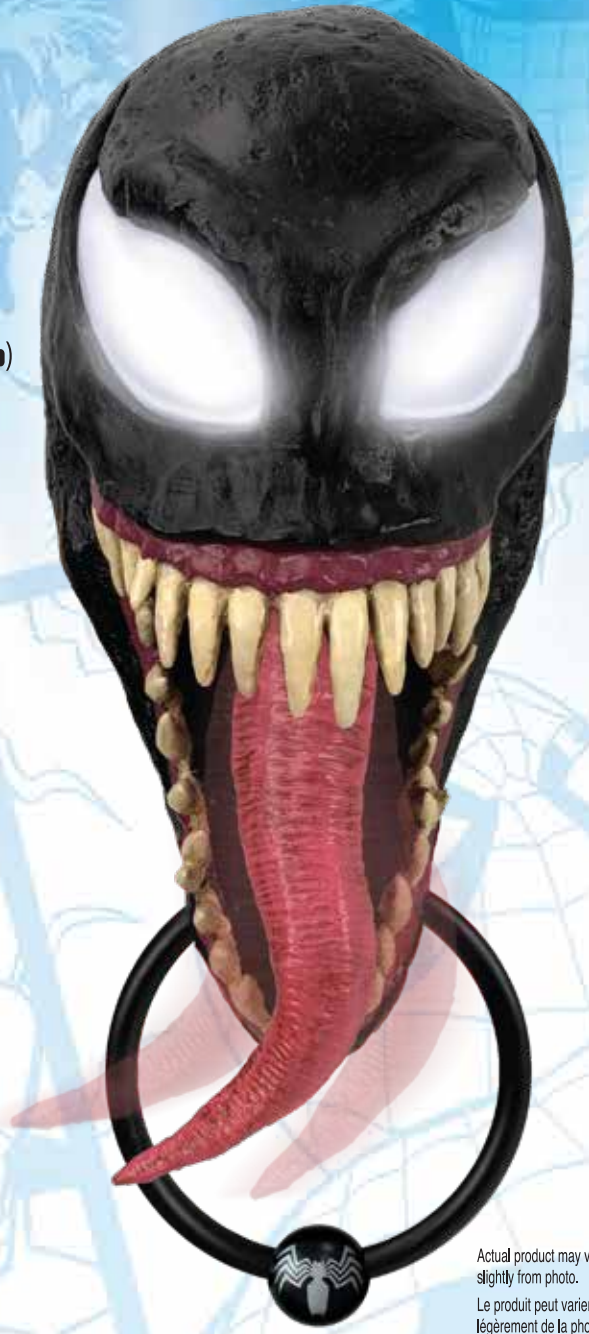
Actual product may vary slightly from photo. Le produit peut varier légèrement de la photo. El producto actual podría variar ligeramente de la foto.